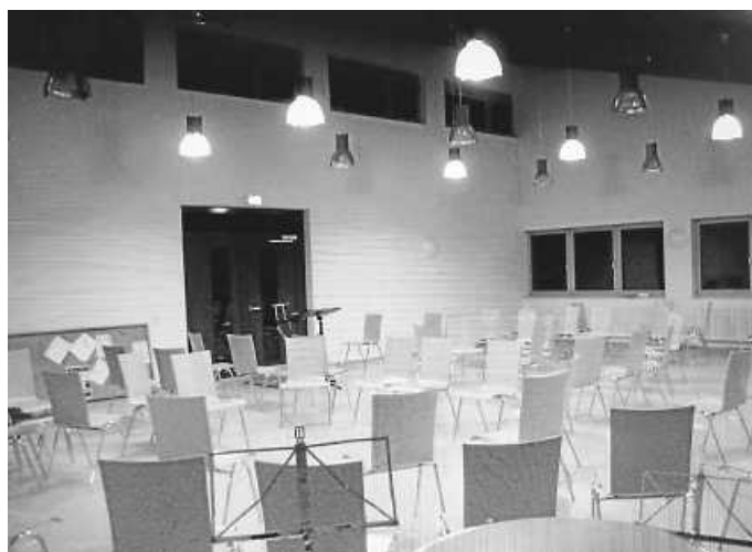
Probelokal nach Fertigstellung

Wichtig für das Jahresrätsel: Den ersten Buchstaben des jeweils monatlichen Lösungswortes unbedingt merken oder notieren!