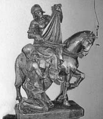
St. Martin - Patron der Kapelle